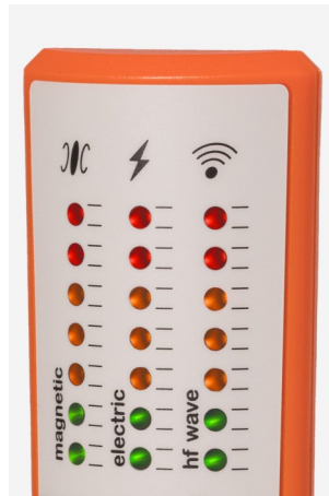
Tableau mode Hypersensible :

Toutefois, si l'analyse acoustique vous dérange, il est possible de l'éteindre facilement en appuyant longuement sur le bouton HF ONLY.