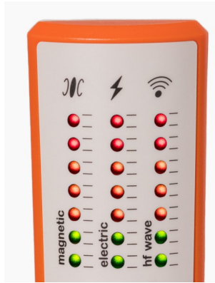
Tableau mode Standard :

NB: pour activer ou désactiver l'indicateur sonore , appuyez longuement sur le bouton select.